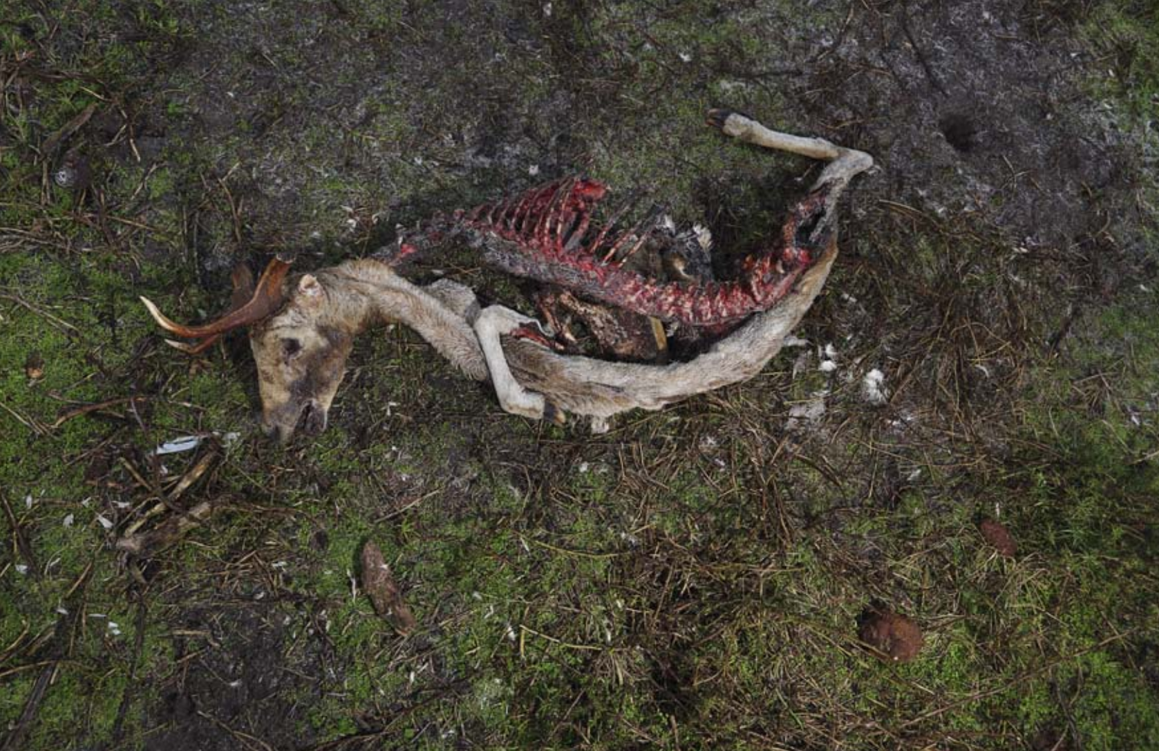
Door vossen kaalgevreten hertenkadaver