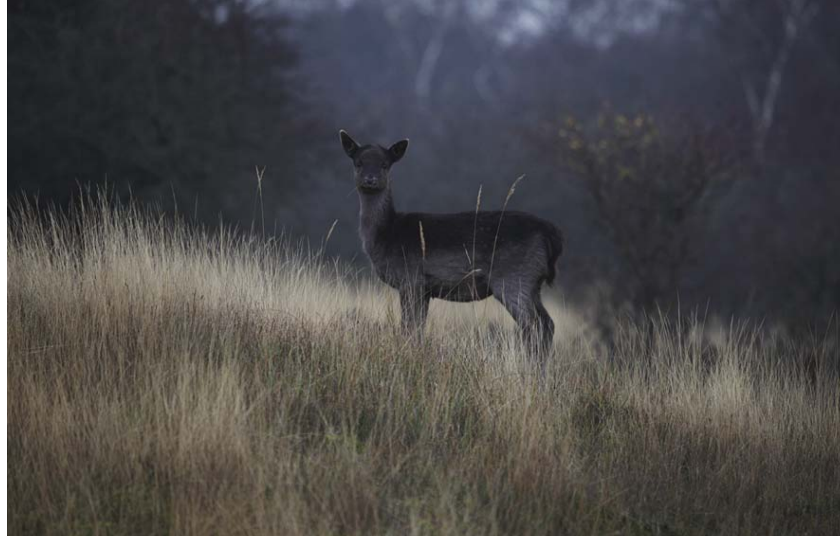
Ecologen hebben berekend dat er maximaal zeshonderd herten in de Waterleidingduinen kunnen leven zonder dat dit leidt tot flinke hongersterfte in de winter

duinen. Veelal uit particuliere parkjes ontsnapt of losgelaten dieren. Nu zijn het er tweeduizend. Over anderhalf jaar, met twee nieuwe geboortegolven, zullen het er drieduizend zijn. En zo verder. Maar in september besloot de gemeenteraad van Amsterdam dat er iets aan gedaan moet worden. En dat 'iets' is geen goed nieuws voor de herten. Ecologen hebben berekend dat er maximaal zeshonderd herten in de Waterleidingduinen kunnen leven zonder dat dit leidt tot flinke hongersterfte in de winter. Met het groeien van de populatie nam het aantal aanvaringen tussen hert en mens hand over hand toe. Vanaf 2009 begonnen de omringende gemeenten Zandvoort en Bloemendaal deze te registreren. Aan de zuidkant van het gebied kwamen meldingen van tuinders. Een beetje hert kan zich binnen een paar uur te goed doen aan honderd bloembollen. Zo'n roedel vreet een half veld kaal, à zestig cent per bol. Reken maar uit wat dat kost. Buurtbewoners – vooral vrouwelijke liefhebbers van tuinieren, verdiept in het bijknippen van de buxushagen – zagen zich ineens omringd door een groep herten, waarvan sommige met dreigend grote geweiën. Er werden hoefafdrukken aangetroffen in het zitkamerparket. Waren de dieren via de openstaande tuindeuren binnen gekomen om het fruit op de eettafel weg te werken. In de avonduren trokken groepjes herten – vaak jonge mannetjes die niet