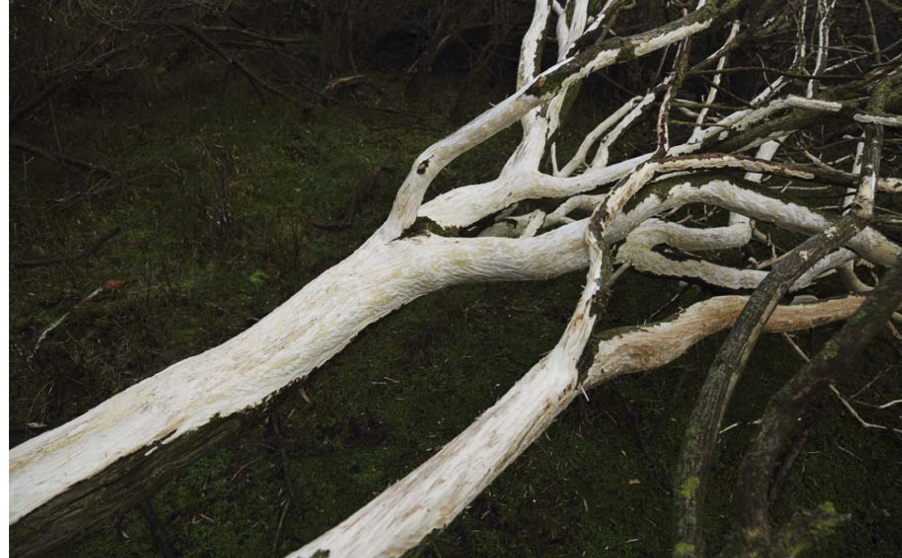
Door herten ontvelde zeldzame kardinaalsmuts

Langs het hek loopt de eeuwenoude beukenweg die de landgoederen langs de kust met elkaar verbindt. Op deze geliefde wandelroute stuitten de wandelaars op de stervende of inmiddels gestorven herten. Normaal legden de boswachters een levenloos dier wat verderop achter de struiken, maar nu vond de sterfte in dergelijk grote omvang plaats dat ze niet altijd in de buurt konden zijn.